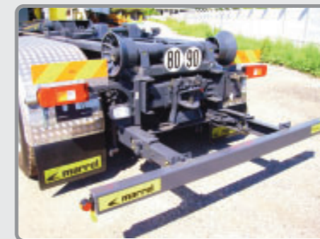
BAE PANTO MARREL