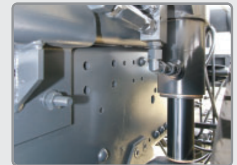
Blocage de suspension