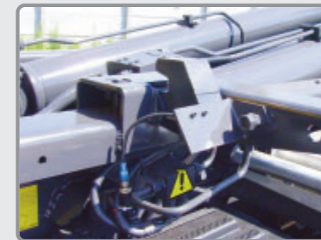
Verrouillage hydraulique AV