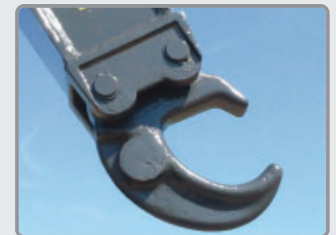
Crochet moulé démontable