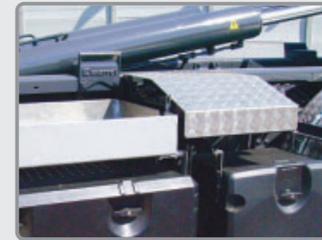
Coffre de prédisposition