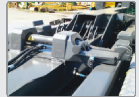
Verrouillage hydraulique AR